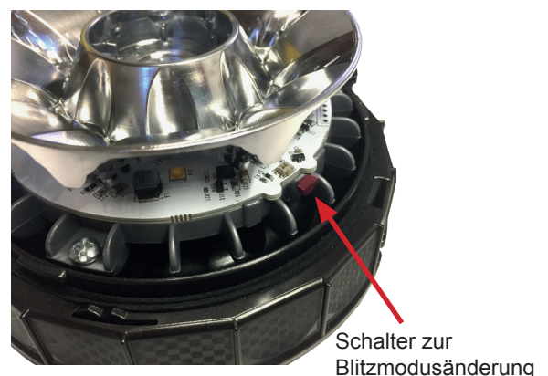
Schalter zur Blitzmodusänderung