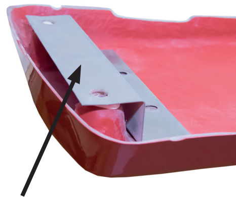
Klemmbefestigung zur Montage in original U-Profilschiene