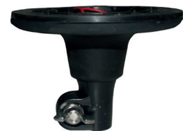
DIN-A Stecksocket flexibel