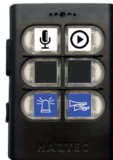
Bedienteil Version COMPLETE