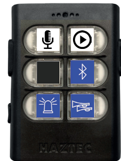
Bedienteil Version COMPLETE+BT