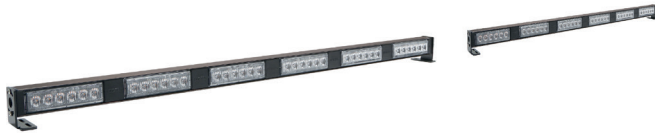
HWS-SLIMLINE 6+6-TWIN ausgeschaltet