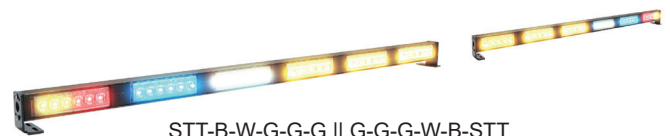
STT-B-W-G-G-G || G-G-G-G-W-B-STT