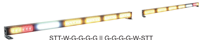
STT-W-G-G-G-G || G-G-G-G-W-STT