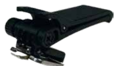
Halterung f. Schulterspanne