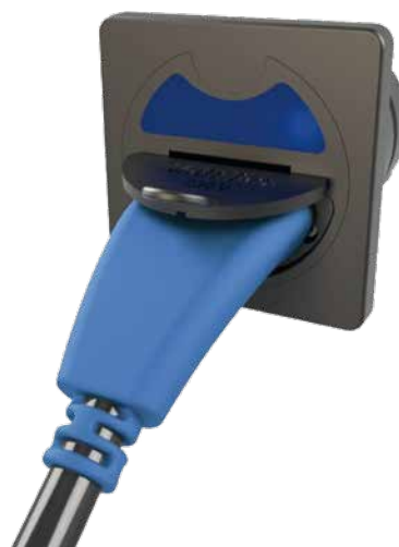
Einspeisesystem mit angesteckter Versorgungsleitung