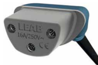
Kupplung mit vorkonfektionierter 5m-Gummileitung